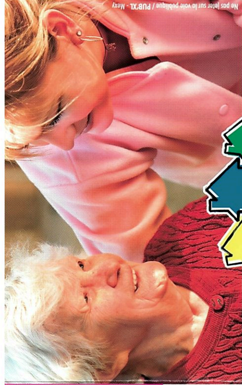
Ne pas jeter sur la voie publique / PUBXL - Mexy

Nous vous proposerons également l'accès à des formations qualifiantes dans le secteur de l'aide à domicile.